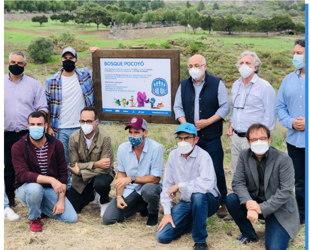
Foto de familia formada por Representantes del Cabildo de Gran Canaria, Fundación Foresta, Zinkia, Koyi y Grupo Musical Efecto Pasillo durante la inauguración de Bosque Pocoyó.