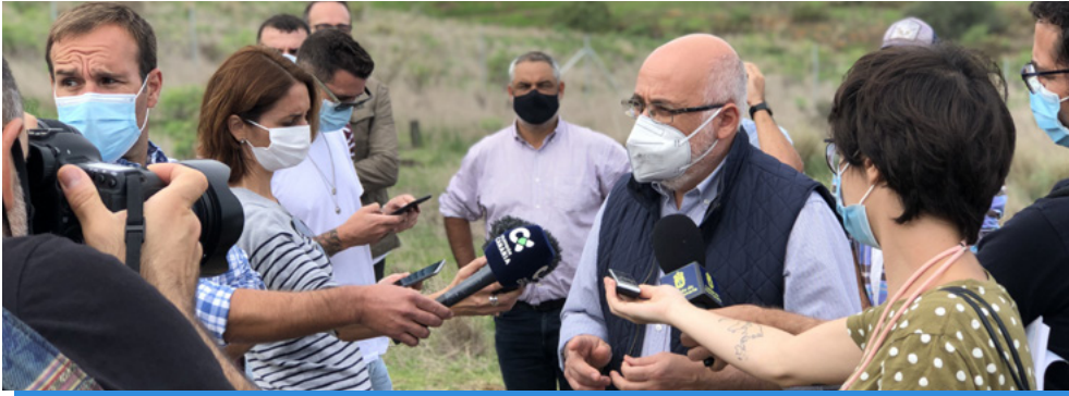
Antonio Morales (Presidente del Cabildo de Gran Canaria) atiende a los medios de comunicación ante esta iniciativa de reforestación.